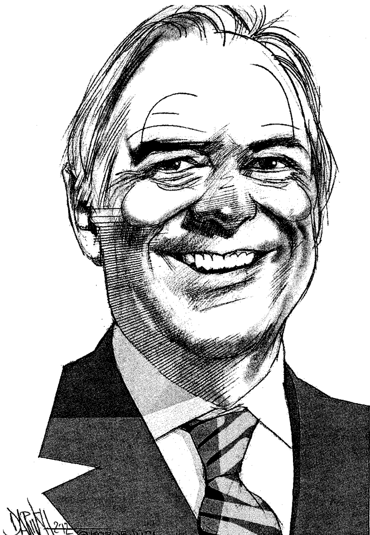
Nel ritratto di Dariusz Radpour , un'immagine di Roland Berger , uno dei più prestigiosi consulenti d'azienda europei

Ritaglio stampa ad uso esclusivo del destinatario, non riproducibile.