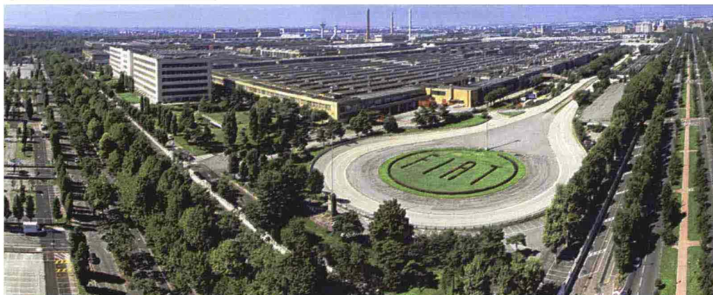
Alcune concept car e, sopra, un'immagine dello storico stabilimento del Lingotto a Torino